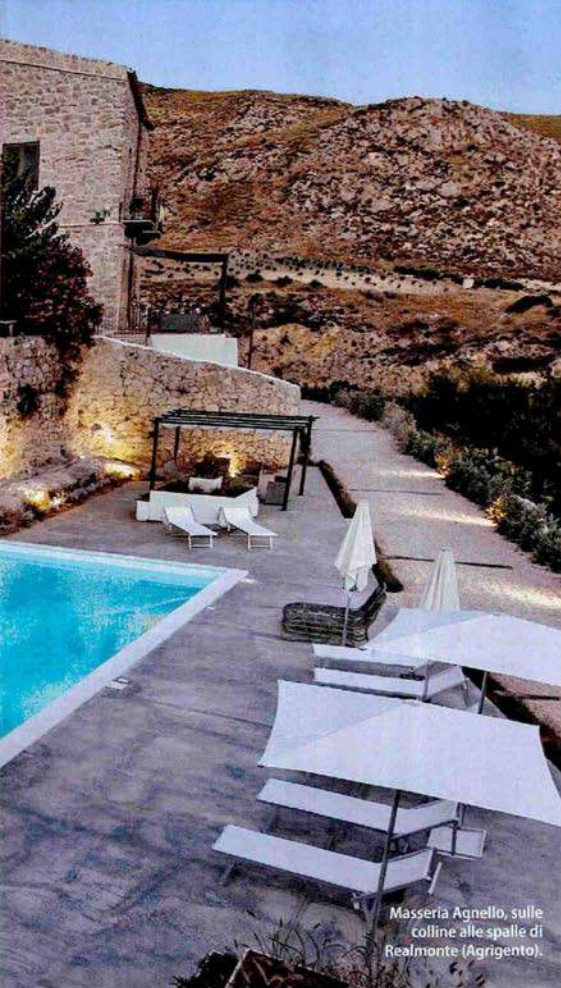
Masseria Agnello, sulle colline alle spalle di Realmonte (Agrigento).