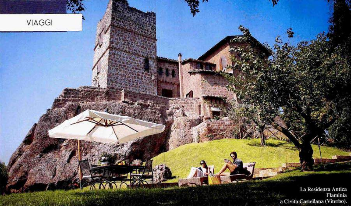
La Residenza Antica Flaminia a Civita Castellana (Viterbo).