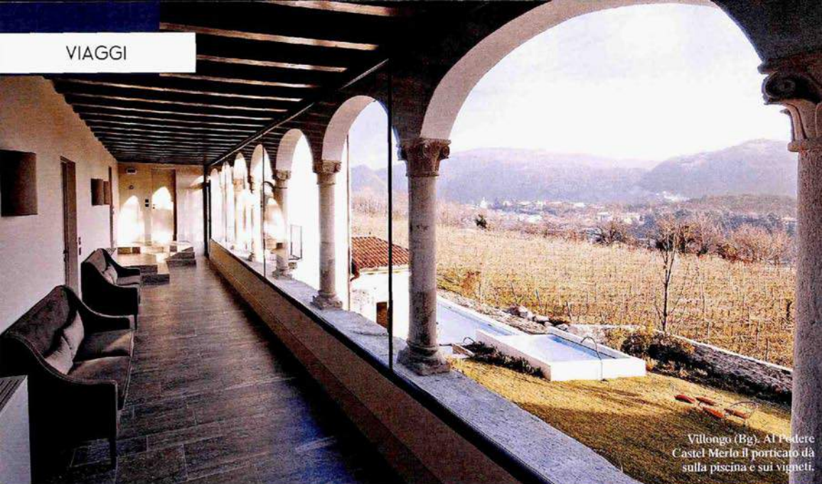
Villongo (Bg). Al Podere Castel Merlo il porticato dà sulla piscina e sui vigneti.